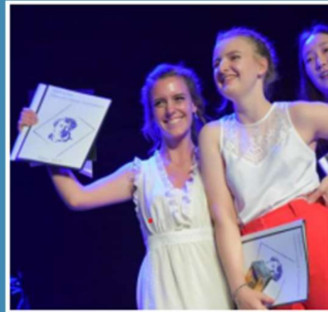
Abimappen (ohne Noten 😊)