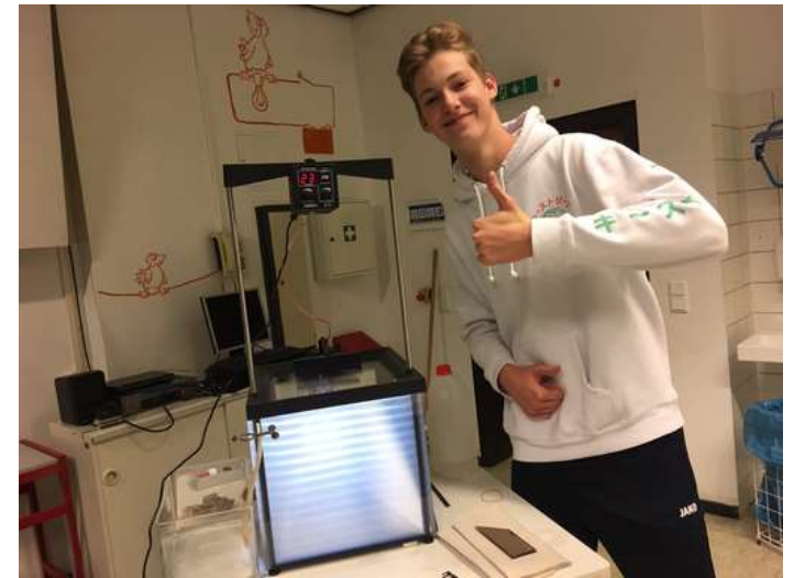
Wellenwanne (Fachschaft Physik)