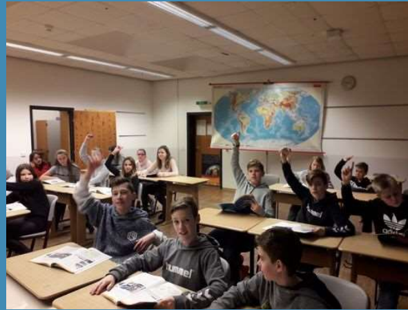
Bücher für bilingualen Unterricht