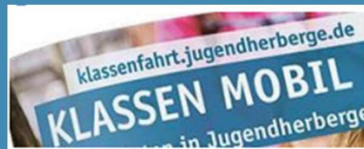
Zuschuss zu Klassenfahrten