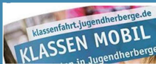
Zuschuss zu Klassenfahrten