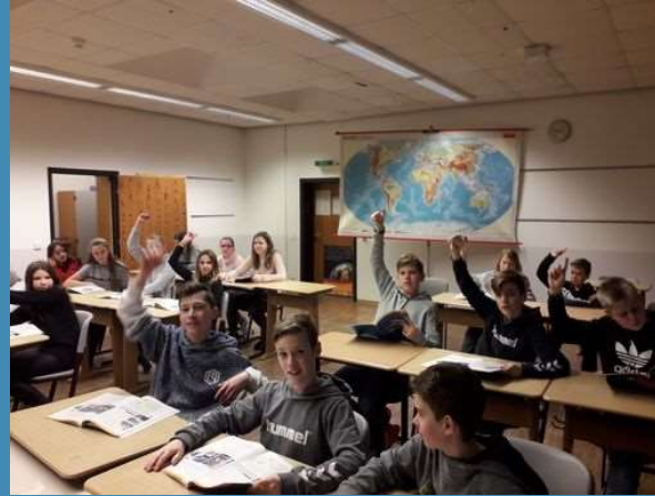
Bücher für bilingualen Unterricht